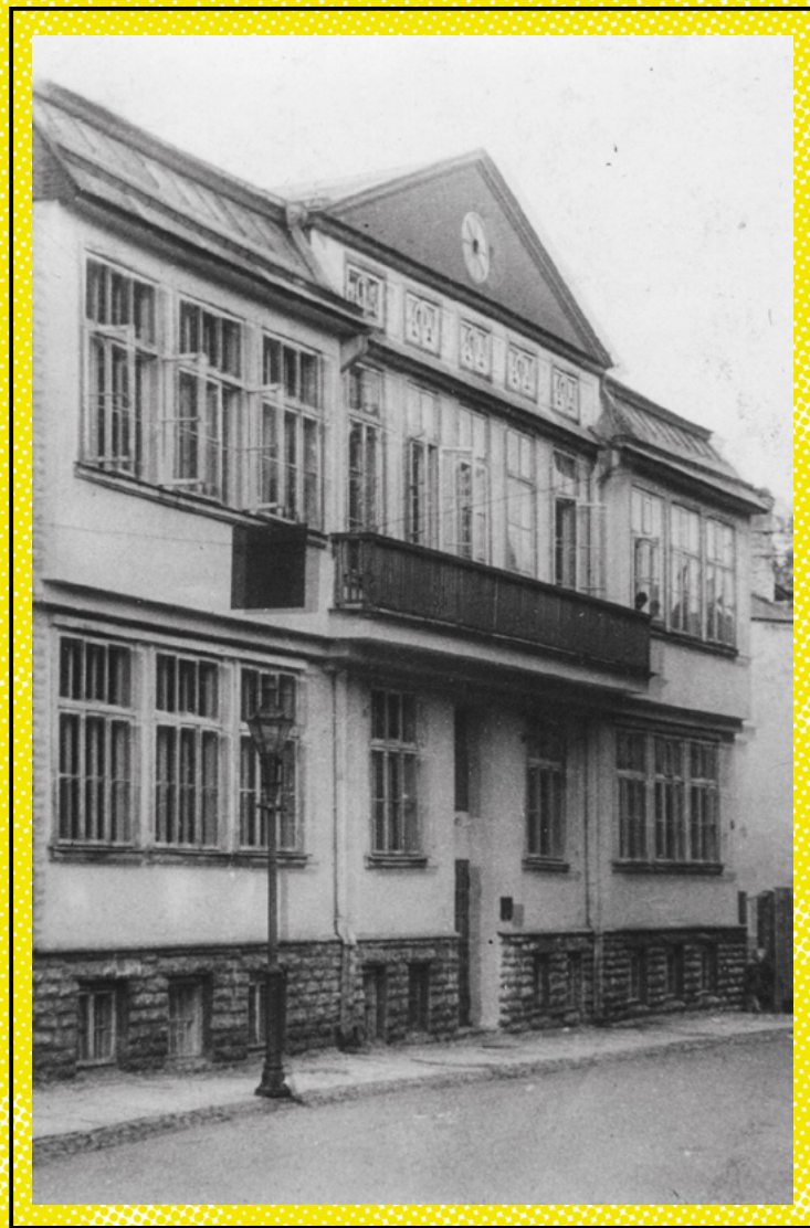
Tallinna 4. Keskkool Kevade tänaval.